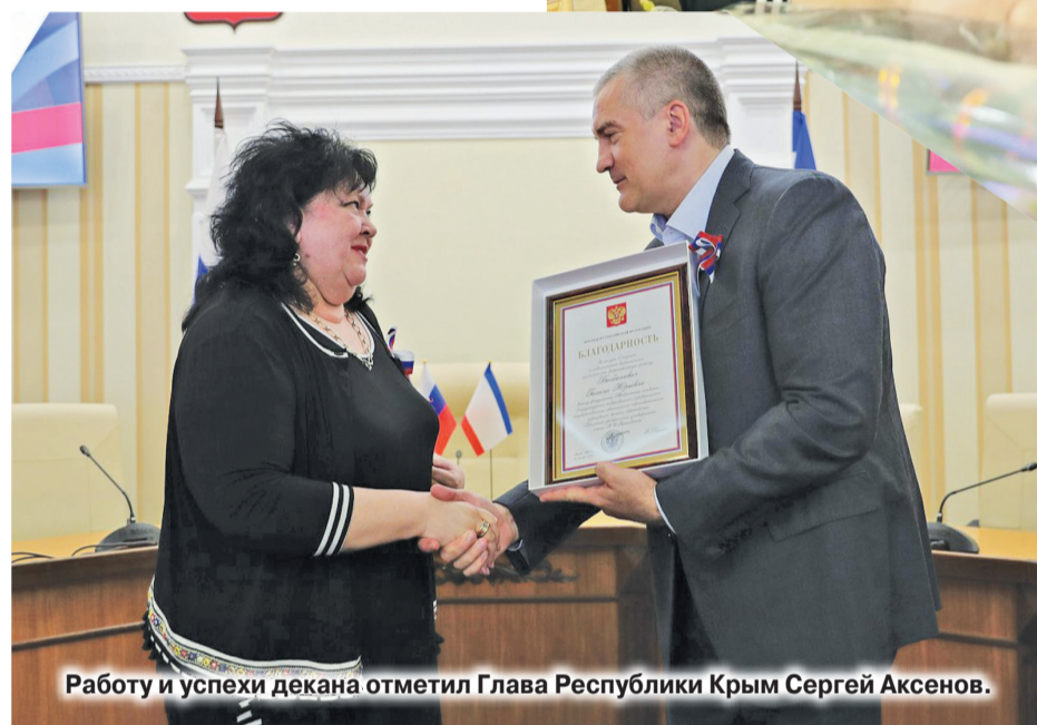
Работу и успехи декана отметил Глава Республики Крым Сергей Аксенов.

— Для нас, крымских филологов и журналистов, это был период утверждения. На Украине у нас была единственная образовательная программа по журналистике на русском языке. От коллектива требовалось очень многое, и не всё проходило гладко. Но мы активно влились в образовательную систему Украины со своей русскоязычной